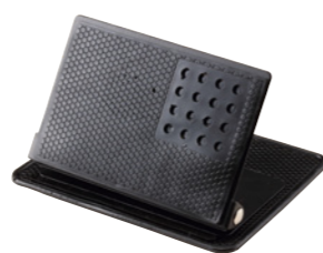
コントローラースタンド 【PS-100】